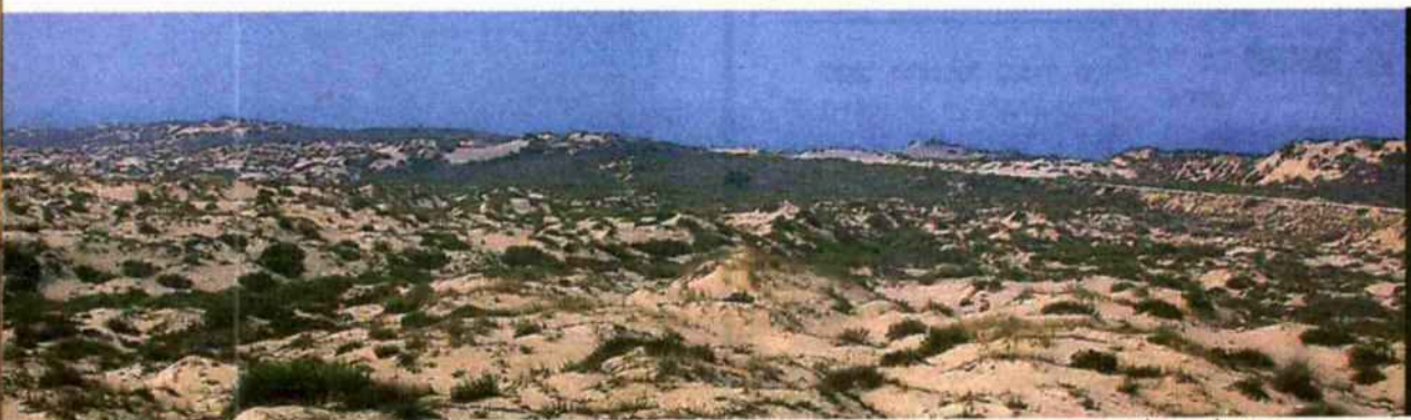
שטח פתוח מצפון לחוף פלמחים