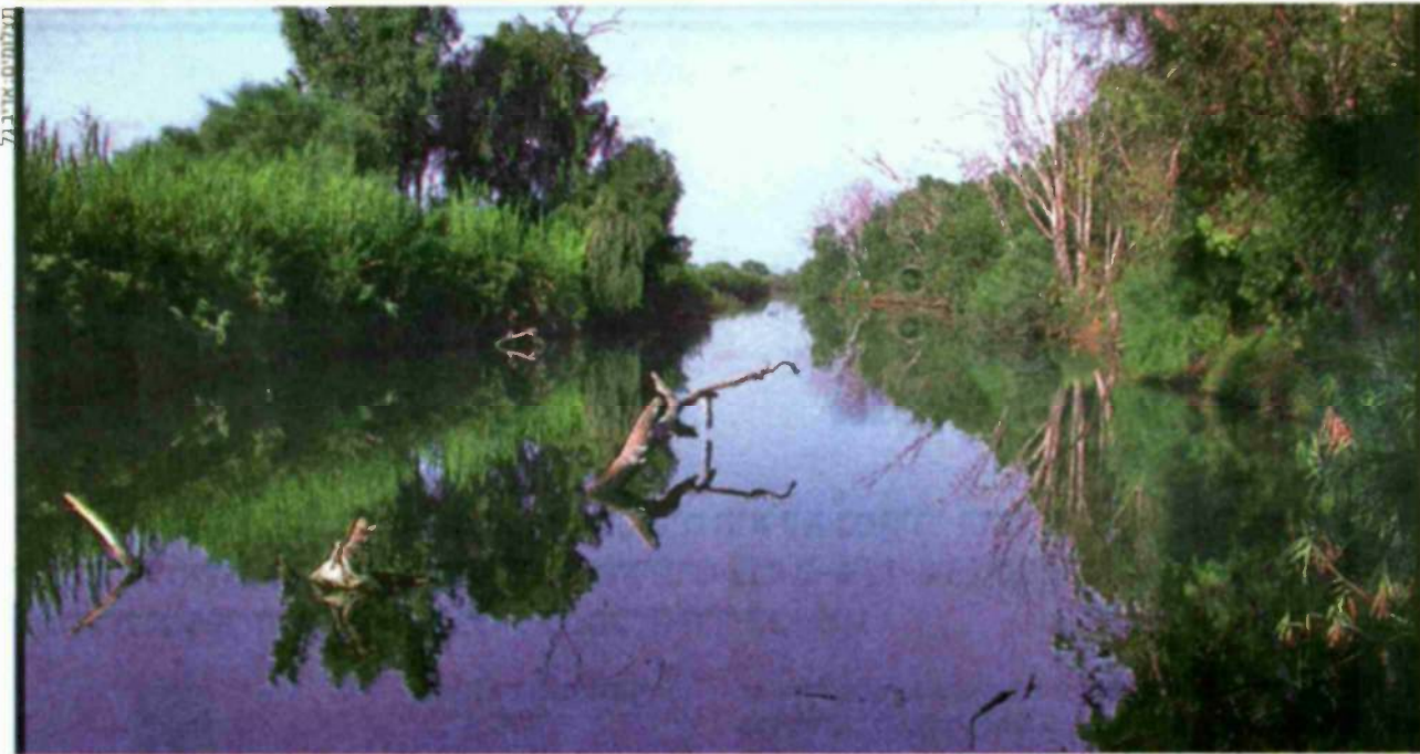
נחל שורק. עדיין מזוהם בשפכים