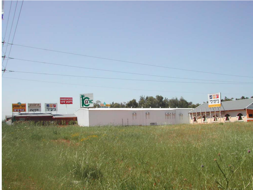
תמונה מס' 1: מרכז קניות אילנות – סמוך ליער אילנות ולשטח המיועד להוות אזור נופש מטרופוליני (מס' 15 במפה 2)