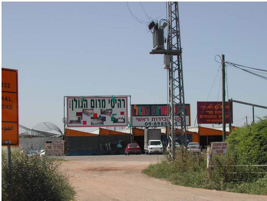
תמונה מס' 2: צומת רופין – מתחם ובו מקבץ שימושים (מס' 8 במפה 1)